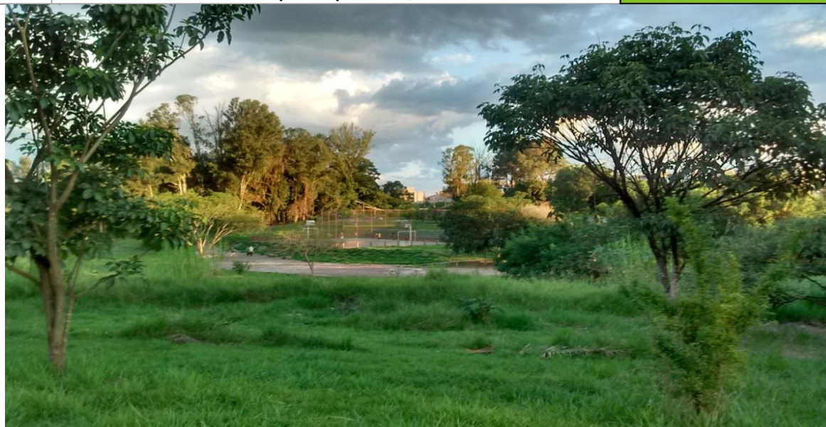
MARTINS, L.C., 2017