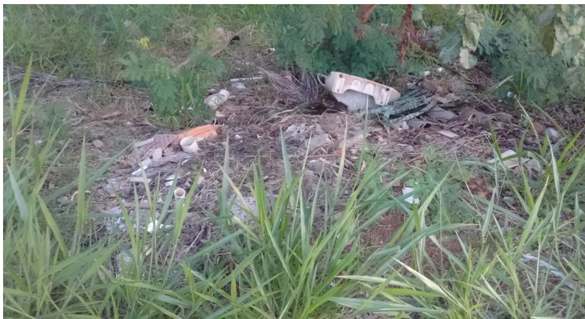
Figura 3: Resíduos descartados no Parque Linear do Córrego do Óleo

Alguns exemplos de resíduos recebidos nos EcoPontos são resíduos de construção civil como tijolos, telhas, argamassa, concreto, tubos, plásticos, papel/papelão, metais, vidros, madeiras, produtos fabricados com gesso, poda de árvores, recicláveis, sofás, armários, pias e vaso sanitário. Entre todos tipos de resíduos descartados na área de APP correspondente ao Parque Linear (Figura 3), maioria poderiam ser descartados nos EcoPontos.