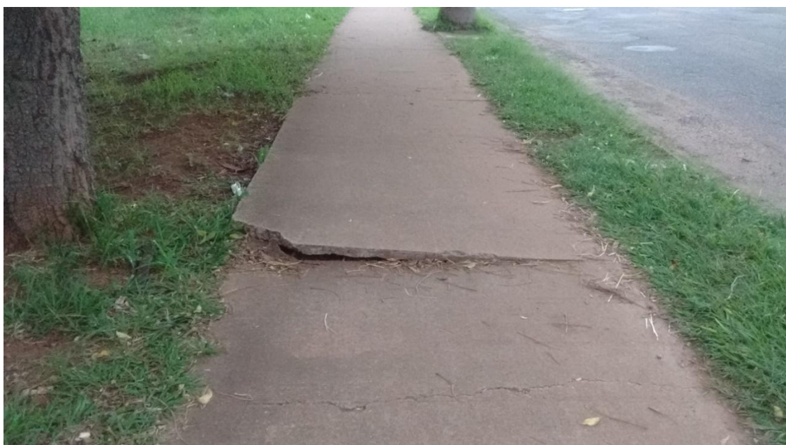
Figura 2: Danos na estrutura da pista de caminhada do Parque Linear do Córrego do Óleo

Entre os equipamentos instalados no Parque Linear do Córrego do Óleo, o primeiro foi a pista de caminhada. Esta pista é utilizada pela população para caminhadas, corridas, e por vezes é utilizada também como ciclovia. Apesar dos projetos, não há uma ciclovia separada da pista de caminhada. Atualmente, a pista apresenta problemas de estrutura (Figura 2) e sua iluminação é precária, impossibilitando seu uso noturno e facilitando o aumento da criminalidade no parque.