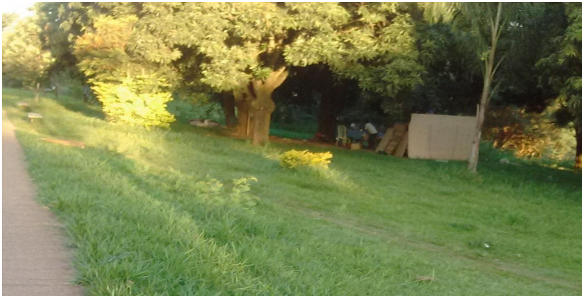
Figura 4: Moradias improvisadas no Parque Linear do Córrego do Óleo

Entre as intervenções que estimulam a interação entre a população e o Parque Linear, é possível destacar ações pontuais como a fazendinhacriada na área de APP por iniciativa de um aposentado. O espaço é dotado de uma estrutura que estimula a interação de crianças com a área com espaços como uma horta, balanços, labirinto, casa na árvore, espaço para leitura, entre outros. (Figura 6),