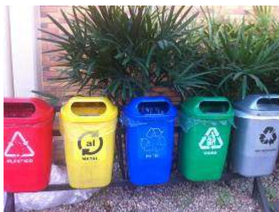
Figura 8. Coletores identificados nas áreas da fábrica

Para facilitar a realização da coleta seletiva nas áreas da fábrica, foram instalados também novos coletores (Figura 8), com melhor identificação de cores e com a descrição do material que pode ser jogado em cada lixeira.