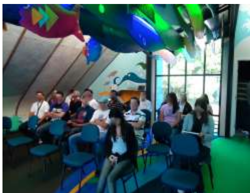
Figura 4. Funcionário participando de treinamento para conscientização de reciclagem.

Como principais riscos tratados verificaram-se o contato com materiais perfurocortantes, pelos funcionários da área de central de reciclagem sem EPI adequado, sendo definido como EPI a luva de limalha de aço para uso durante a segregação de materiais que venham de áreas onde há materiais perfurocortantes. Vale lembrar que esta atividade causou um acidente com afastamento na área durante o ano 2012.