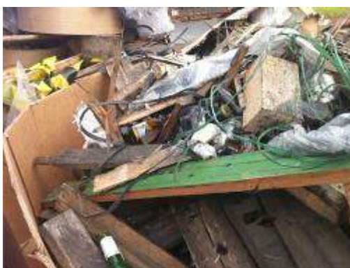
Figura 5. Exemplo de material coletado e depositado no setor de envase não separado adequadamente antes da realização de treinamento

Observa-se, na Figura 5, que a segregação dos materiais não era realizada nas áreas da fábrica, e após treinamento na fábrica os materiais passaram a ser separados (figuras 6 e 7) uma vez que em um mesmo coletor se encontravam materiais de vários grupos e sem a correta segregação definida pelo CONAMA 358/2005 e 257/1999;: