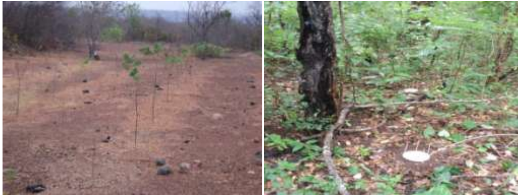
Figura 2: Vista parcial das áreas de plantio de Enterolobium contortisiliquum e de uma floresta secundária de transição caatinga-cerrado.

Em cada área foram instaladas e distribuídas aleatoriamente 10 armadilhas do tipo “pitt fall” utilizadas para a avaliação da atividade da fauna epígea (Figura 3). Na confecção dos “pitt fall” foi utilizado um pote plástico com 11 cm de diâmetro e 7,5 cm de profundidade. Também se utilizou um prato plástico com 15 cm de diâmetro para cobrir os potes plásticos e proteger contra a ação da chuva sendo que foi fixado no solo com auxílio de palitos de madeira de forma que estes não impedissem que a mesofauna fosse capturada. Dentro de cada pote foi colocada uma solução de formol 4% para preservação da fauna no período de uso do “pitt fall”. As armadilhas foram colocadas na interface solo-serrapilheira e permaneceram durante sete dias no campo. Foi monitorada a temperatura do solo com um geotermômetro e a umidade do solo pelo método gravimétrico no dia da instalação das armadilhas (“pitt fall”) (EMBRAPA, 1997).