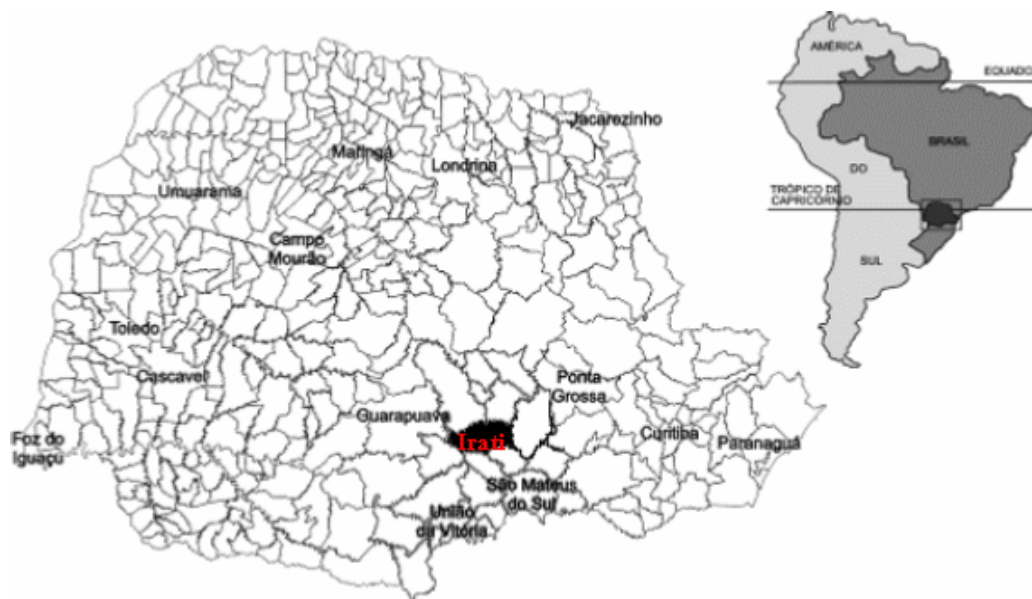
Figura 1 – Localização do município de Irati – sem escala

O município de Irati está localizado na zona fisiográfica de Irati, uma das onze zonas em que o Paraná se divide. Encontra-se na sub-região dos pinhais, no segundo planalto do Paraná ou planalto de Ponta Grossa, tem como coordenadas geográficas: -25^{\circ}25'05'' a -25^{\circ}32'38'' de latitude Sul e -50^{\circ}32'42'' a -50^{\circ}42'05'' de longitude Oeste. Situa-se à distância de 138km em linha reta na direção 88^{\circ}21' Oeste e a 150,34km pela BR 277, de Curitiba, capital do Estado, fazendo divisa com os municípios de Imbituva, Prudentópolis, Inácio Martins, Rio Azul, Rebouças e Fernandes Pinheiro, Figura 1. Situa-se na região centro-sul do estado, de clima temperado (Cfb), com temperatura desde o mínimo de -5^{\circ}\text{C} , até o máximo de 38^{\circ}\text{C} . As geadas são frequentes e as chuvas caem com mais intensidade de setembro a fevereiro (IPARDES, 2006).