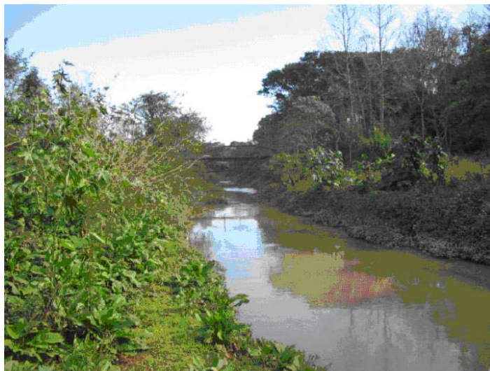
Figura 07 – Parque Ambiental, um dos pontos retinizados e assoreados.