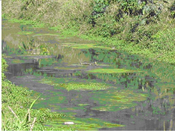
Figura 09 – Acumulação de algas provenientes de resíduos orgânicos