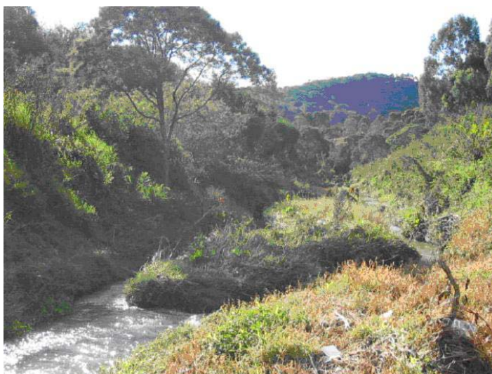
Figura 08 – Ilha fluvial atrás do Irati Sport Clube