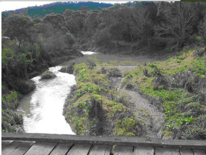
Figura 06 – Formação de área de sedimentação próximo ao Parque Ambiental