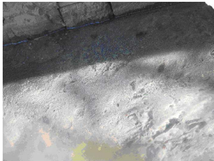
Figura 10 – Resíduos químicos na confluência do Arroio dos Pereiras com o rio das Antas

A retificação do rio ocorrida em vários pontos da área urbana, procurando acomodar melhor a estrutura social e econômica existente, está proporcionando a ocorrência de processos geomorfológicos que modificam a dinâmica fluvial natural e o principal testemunho desta ocorrência é o assoreamento das margens (Figura 07) e a formação de ilhas fluviais (Figura 08).