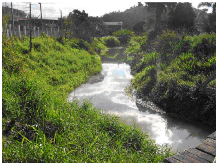
Figura 04 – Ponte próxima à subida do Morro da Santa (Centro)

Em princípio, o objetivo do trabalho era uma análise das condições atuais do rio das Antas e sua bacia, tendo como base os aspectos visuais da degradação ocasionada pelo lixo urbano, o que no decorrer do trabalho se mostrou pouco impactante, devido à pouca quantidade de resíduos sólidos encontrados, conforme mostra a Figura 04.