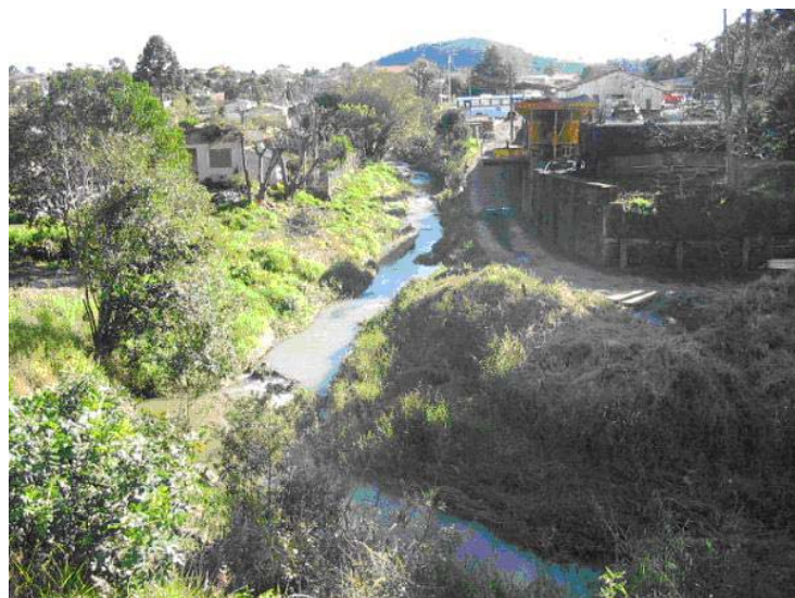
Figura 05 – Ocupação desordenada no bairro Rio Bonito